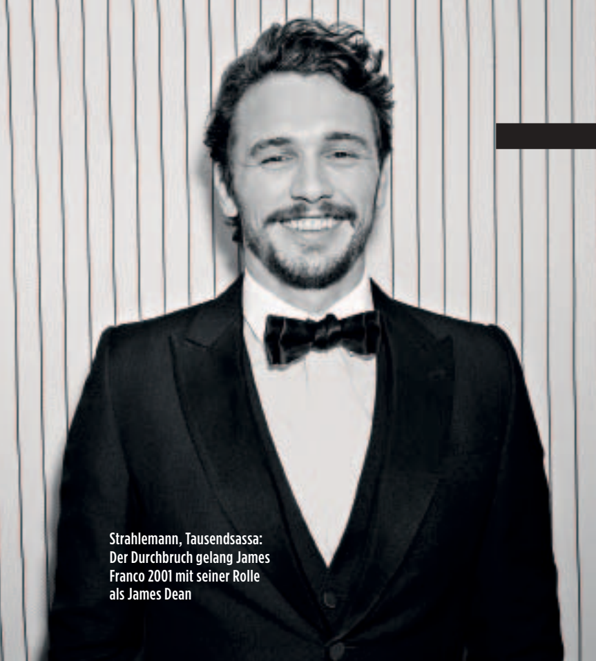
Strahlemann, Tausendsassa: Der Durchbruch gelang James Franco 2001 mit seiner Rolle als James Dean

D er Ort ist perfekt für ein Date mit James Franco. Ein wabenartiges Messebüro, karg, stickig, neonbelichtet. Trostlos eben. Eine Etage tiefer, im festlichen Saal des Londoner Billingsgate Market: Glitzer und Glamour! Es wummert „Up All Night“ durch die Boxen, Peaches Geldof und Amber Le Bon wippen mit den High Heels und rühren in ihren Longdrinks. Eben hat Franco mit Sienna Miller den neuen BMW i3 enthüllt, wirkte neben der Hochglanz-Blondine fast ungenlenk. Hier oben, im Abseits, fühlt er sich offensichtlich wohler. Sein Gesicht, Michelangelo hätte es nicht perfekter hinbekommen, wirkt entspannt. Ob er gleich in den berühmigten Sekundenschlaf fällt, wie von Kollegen aus diversen Interviews berichtet? Unwahrscheinlich. James Francos Geist ist hellwach. Wer weiß: Vielleicht findet sich eine Anekdote oder ein Splitter dieses Abends bald sogar in einer seiner Kurzgeschichten oder Installationen wieder.